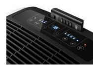
PANEL DE CONTROL DE TACTO SUAVE

El silencio del poder. Pinguino EM93, hasta un 37% MÁS SILENCIOSO **** gracias a la tecnología DL